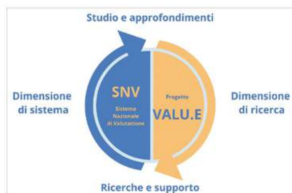
Fig. 1 - Rappresentazione grafica dell'obiettivo di integrazione e sinergia tra la dimensione sistemica del Sistema Nazionale di Valutazione (SNV) e la dimensione di ricerca e riflessione scientifica offerta dal Progetto PON VALU.E

Azione 3 – Delineare le competenze decentrate per la valutazione. La finalità complessiva dell'Azione 3 è stata quella di elaborare e sperimentare modelli prototipali per la definizione e formazione delle competenze per la valutazione delle istituzioni scolastiche e formative.